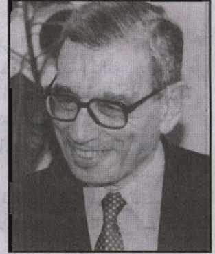
د. بطرس غالى

● يقول د/ بطرس غالى الأمين العام للأمم المتحدة السابق أن السياحة لم تعد من الرفاهية